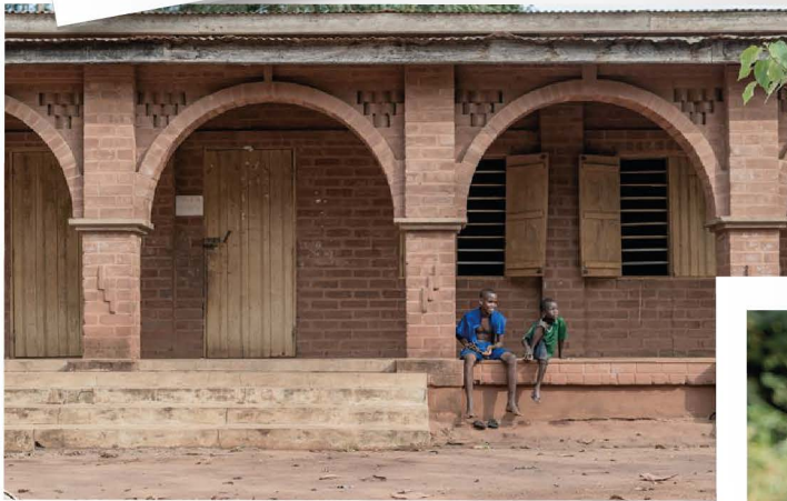
Une école construite par Sichem