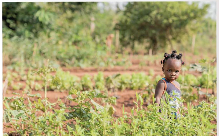
Une jolie fleur africaine

Depuis deux jours le groupe est perturbé par des désagréments dus à la très forte chaleur, les émotions, la fatigue... le grand marché de Lomé est oppressant... du coup davantage de repos au centre pour les fatigués, et activités moins intenses : un peu d'animation dans une école, tournée du bibliobus, briques et bibliothèque. Demain, pour les vaillants, retrouvailles avec les jeunes du groupe culturel Dunenyo au lac Togo.