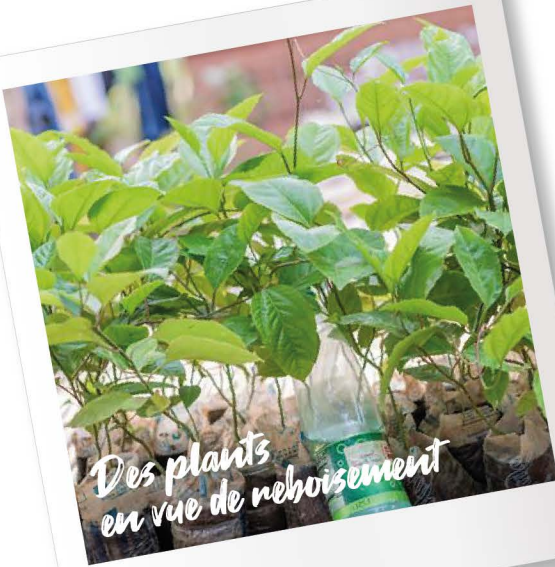
Des plants en vue de reboisement