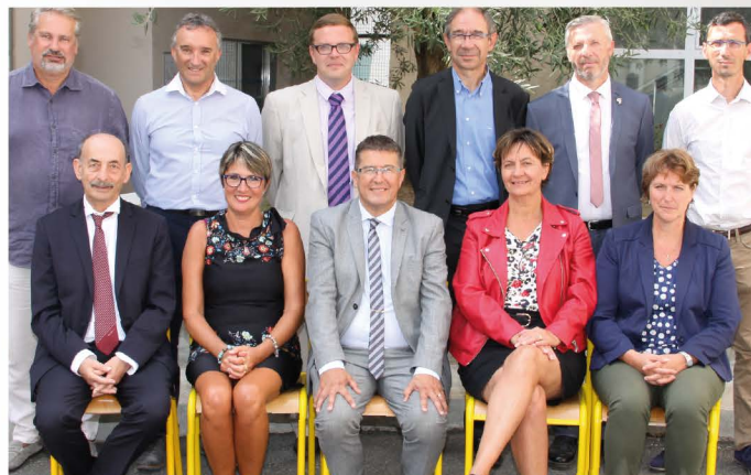
Le conseil de direction