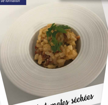
Risotto de tomates séchées