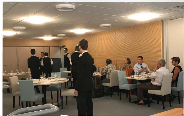
En salle !