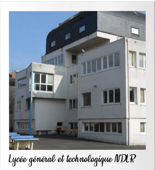
Lycée général et technologique NDLR

Un nouveau gros chantier allait "secouer" l'établissement, et plus précisément le bâtiment du lycée général et technologique.