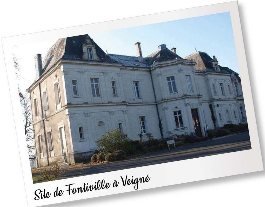
Site de Fontiville à Veigné

Mais qui dit École hôtelière dit aussi lieu de formation adapté ! Pour apprendre à être cuisinier il faut pouvoir travailler en cuisine !