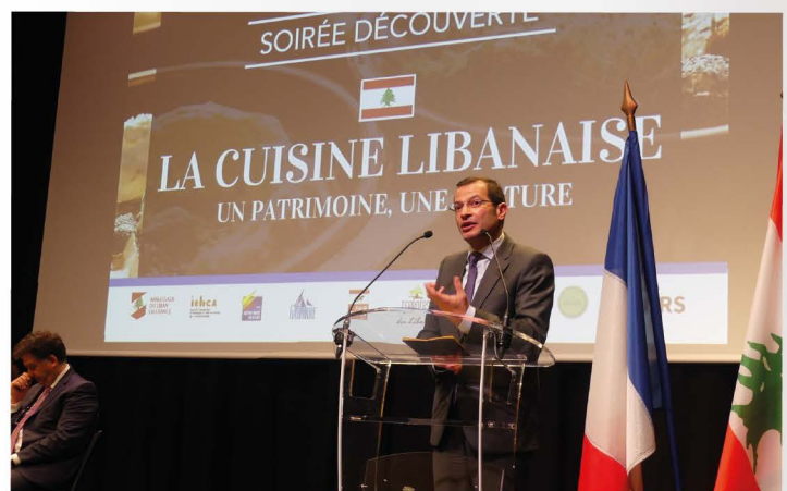
Son Excellence M. ADWAN Rami, ambassadeur du Liban en France

Au menu des mezzés en amuse-bouches, une salade libanaise en entrée (à base de persil, de citron et de grenade), en plat principal un poulet riz aux sept épices et pour le dessert, un assortiment de trois atayefs (petite crêpes libanaises fourrées à la crème de lait).