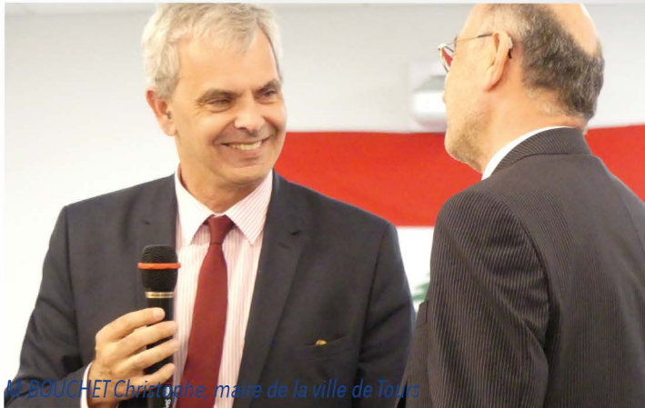
M. BONCHET Christophe, maire de la ville de Tours