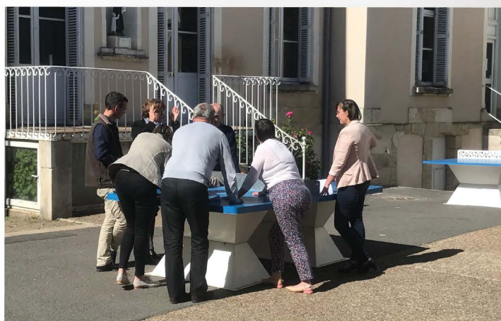
Reflexion autour du thème «le bien-être en milieu scolaire»