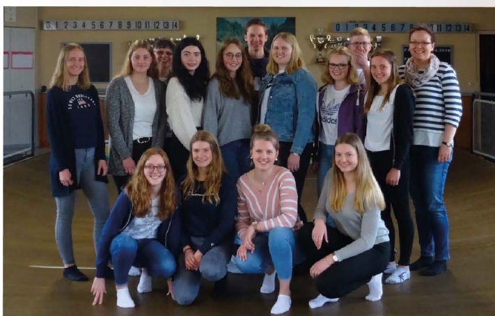
Dans la salle boules de fort.

Correspondants de Handrup (Allemagne) avec leurs professeurs.