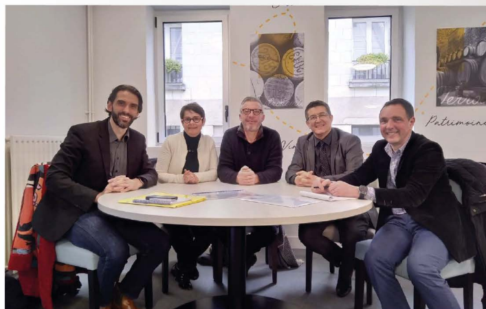
C'est officiel, NDLR signe la réalisation de 500 couverts

*Centre des Jeunes Dirigeants d'entreprise