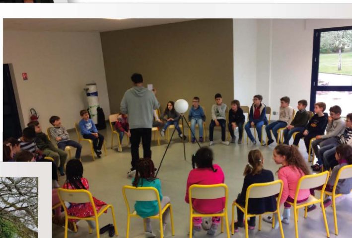
Animation sur l'astrologie