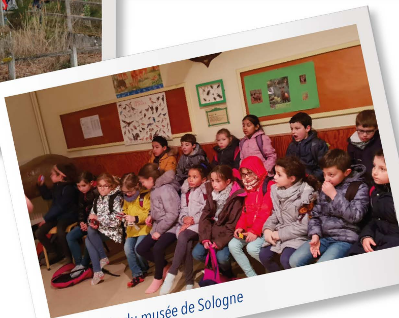
Découverte du musée de Sologne

+d'infos sur le blog de l'école https://fenetre22.blogspot.com