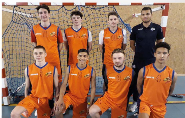
Futurs champions ?