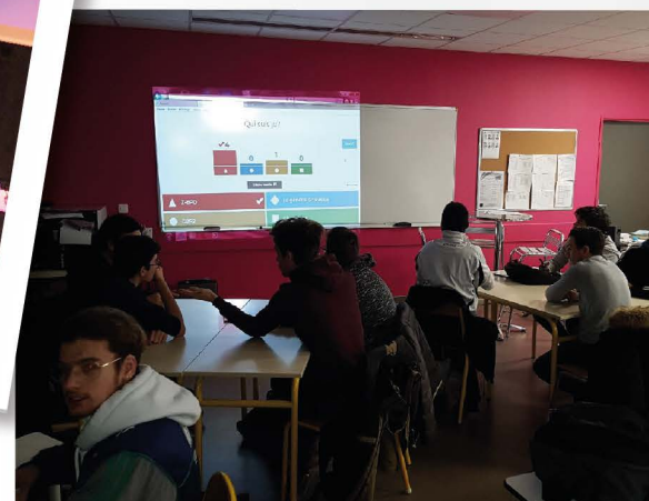
Les SN sur leur kahoot