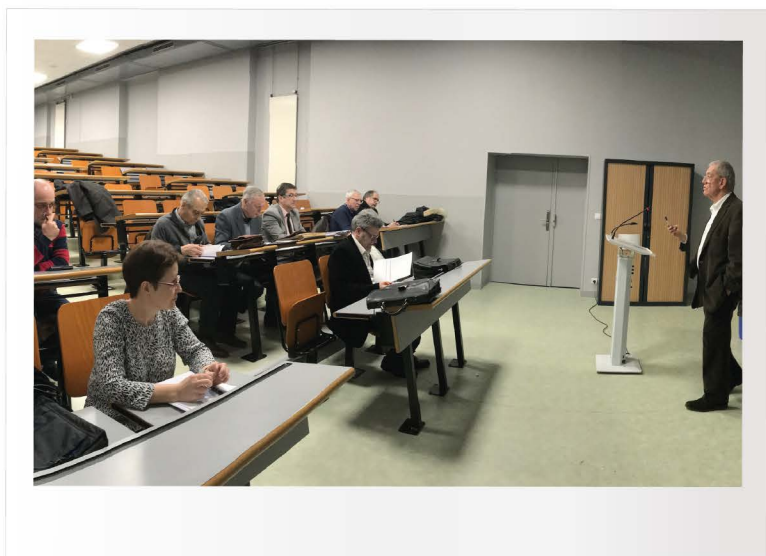
CA OGEC Mercredi 6 février 2019