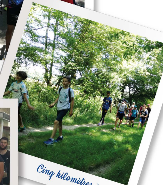
Cinq kilomètres à pieds...