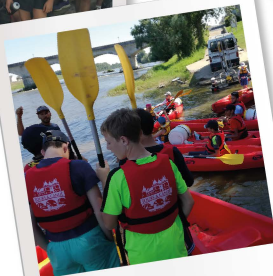
À l'eau !

Nous avons ensuite traversé ensemble toute la forêt pour arriver au château d'Amboise vers 17h. Nous avons bivouaqué au camping de l'île d'Or avec un barbecue pour récompenser les efforts de la journée.