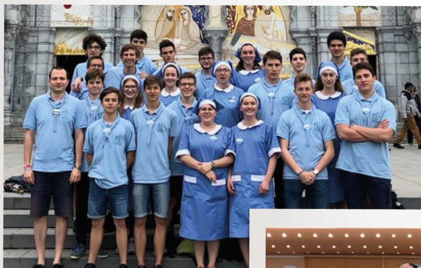
Le groupe de l'institution Notre-Dame La Riche*

grande première, d'autres venaient pour la seconde fois, et certains habitués ont même été appelés à la « reconnaissance » (première étape de l'engagement d'hospitalier).