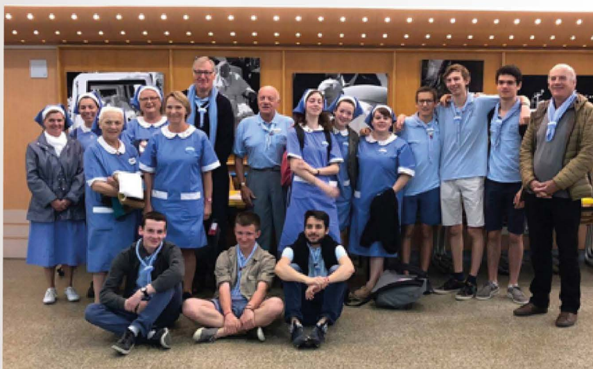
Les engagés d'avril

Si pour la plupart d'entre-eux c'était une