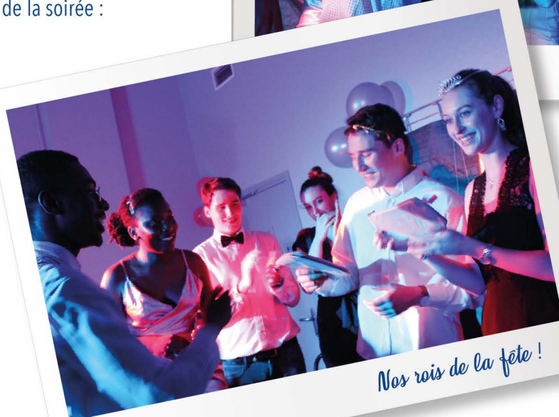
Nos rois de la fête !