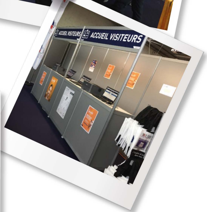
*Accueil Relation Clients et Usagers